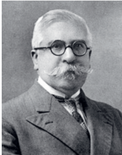
Figure 1. Portrait de Léonce Joleaud